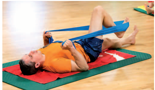
Trainieren mit dem Theraband, im Rehasport sehr beliebt