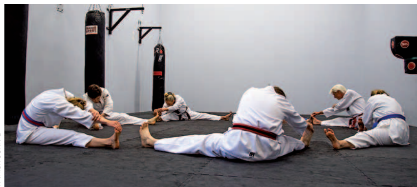
Hier geht's um die Dehnung

Taekwondo ist eine koreanische Kampfkunst der waffenlosen Selbstverteidigung. Die drei Silben des Namens stehen für Fußtechnik (tae), Handtechnik (kwon) und Weg (do). Es handelt sich dabei um einen Sport mit sehr dynamischen Bewegungen, der in jedem Alter erlernt und ausgeübt werden kann. Körper und Geist werden gleichermaßen in Einklang gebracht. Folgende Teildisziplinen