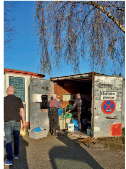
Biker haben keine Höhenangst: Der Abbau am alten Standort bei der Ringeltauibe