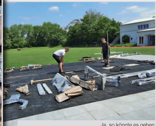
Ja, so könnte es gehen