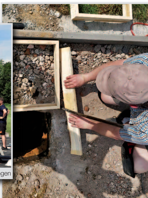
Präzision ist wichtig