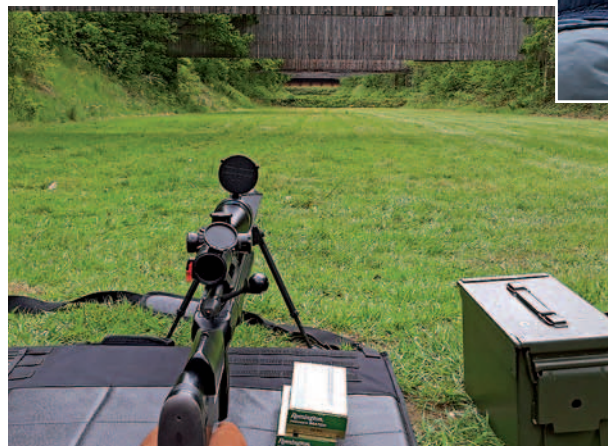
Vorbereitungen für ZG3 - das Sako TRG 22 Präzisionsgewehr

nen Dienstgewehr2 (DG2), Zielfernrohr-gewehr2 und 3 (ZG2 und ZG3). Alle Disziplinen werden auf eine Entfernung von 300 m geschossen, wobei DG2 liegend freihändig mit offener Visierung (also