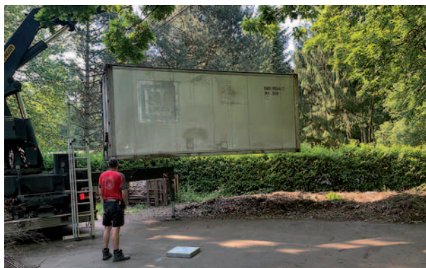
Und jetzt: Runter damit!