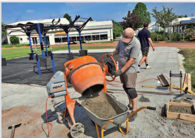
Zuerst das Fundament