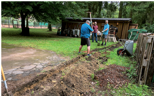
Der Graben für das Stromkabel wird ausgehoben