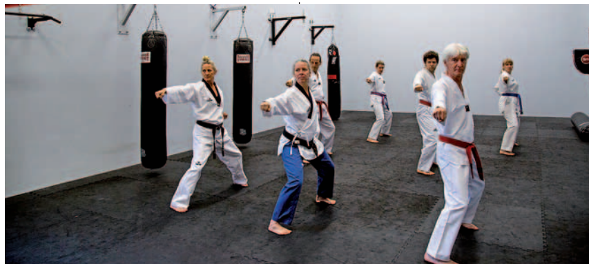
Beim Training im Boxraum auf der Sportanlage