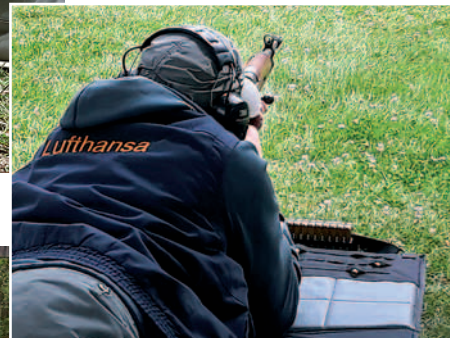
Lufthanseat beim Schießen der Disziplin DG2