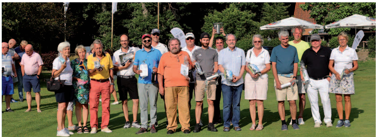
Die Sieger des Turniers