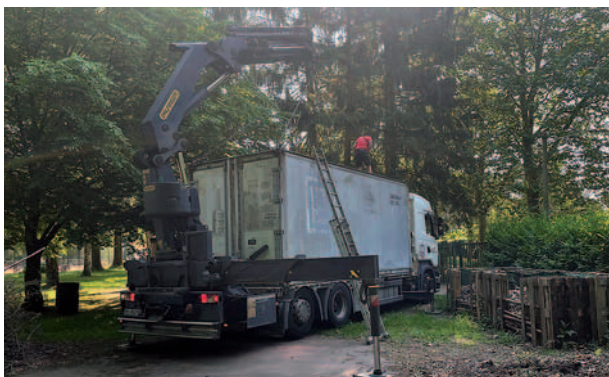
Die Anlieferung des Containers