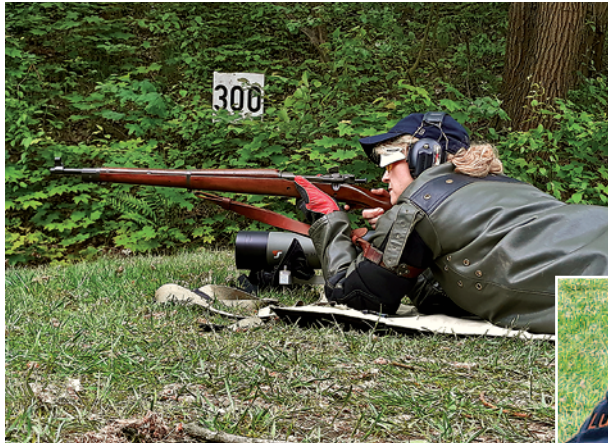
Eine Schützin (mit ihrem Springfield M1903) beim Schießen der Disziplin DG2