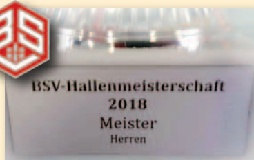
Spielen um die Meisterschaft – dafür brauchen wir dich!

übermäßiger Härte gespielt wird. Dies können wir für die BSV Liga- und Pokalrunden nicht bestätigen. Es wird sehr fair gespielt, und die Schiedsrichter unterbinden schnell überharte Aktionen von übermotivierten Spielern.