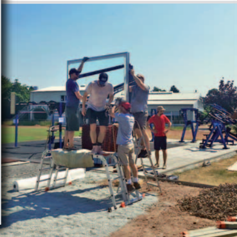
Der Turmbau zu Groß-Borstel