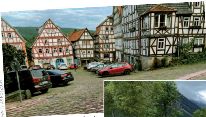
Das verträumte Städtchen Steingaden

Das Treffen fand vom 8. bis 11. Juli 2021 (Do-So) in Steingaden im Allgäu statt. Veranstalter waren unsere Münchener Lufthanseaten. Angereist wurde wieder aus der ganzen Republik. Für uns Nordlichter waren es insgesamt (Anreise, zwei Tagestouren, Abreise) rund 2200 km. Eine Neunergruppe reiste mit je einer Zwischenübernachtung an und ab. Andere Hamburger haben das Treffen in einen längeren Motorradurlaub eingebunden.