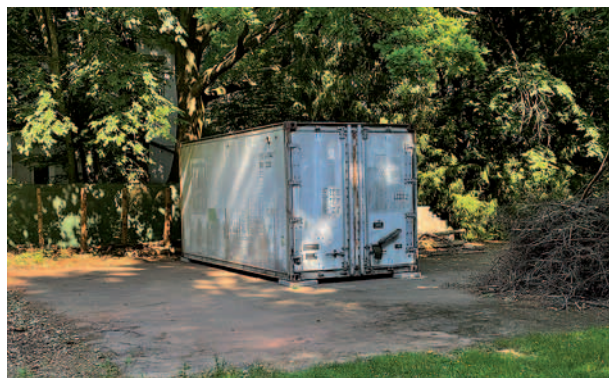
Unser neues Zuhause im Grünen