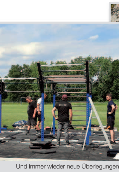
Und immer wieder neue Überlegungen